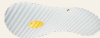
GEONADO-ENERGIE-WELLE FÜR IHREN WOHN- UND ARBEITSBEREICH